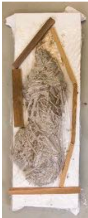
afbeelding 6 'In between'

Illustratief voor het thema 'verval en gestold leven' is het werk 'In between'. Dit werk bestaat uit een combinatie van houtjes, condens en klei op een kleilap. Spierenburg merkte dat zij gelijk een associatie kreeg van een laken en daarmee drong 'de fase tussen leven en dood' zich meteen als onderwerp op (afbeelding 6). Het vangen van één moment was hier door toeval beter gelukt, dan wanneer ze dit gegeven technisch perfect probeerde uit te werken. Deze fase heeft Eva vastgelegd in een foto om zo als prints te behouden. Dit beeld is al vaker in werk teruggekomen.