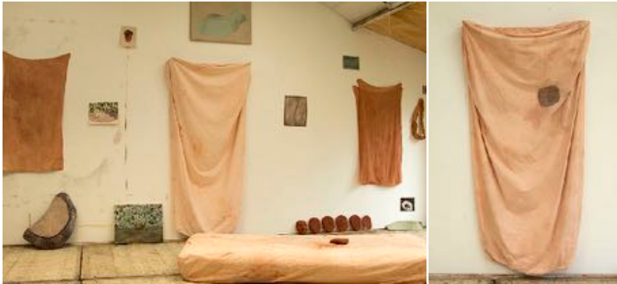
Afbeeldingen 4 en 5: 'Matrashoezen' (nog in ontwikkeling, dus nog geen titel).

De werken worden niet bijgeschaafd door twijfel die achteraf toeslaat. Ze probeert het beoordelen en twijfelen daarover dus zoveel mogelijk uit het atelier te laten.