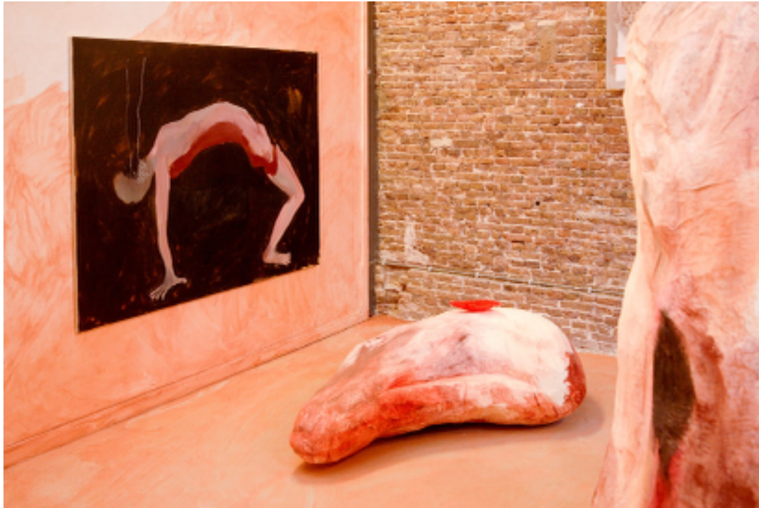
afb 2: aan de muur: 'being exposed' 2016, 140x190 cm, acrylic, ink and charcoal on linen