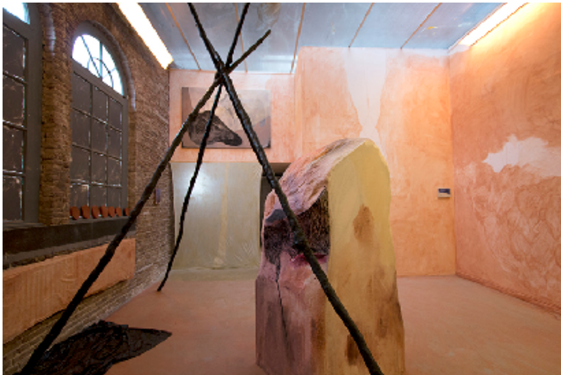
afb 3: 'the body and the ground' ,installation - RijksakademieOPEN 2016, i.a. clay, rubber, styrofoam, textile, acrylic, plaster